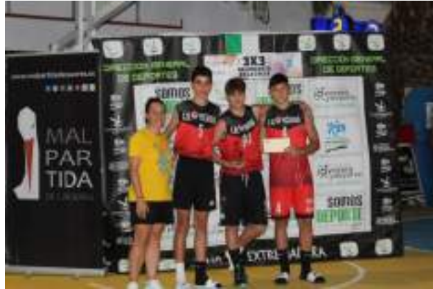
1º CLASIFICADO SUB 16 MASCULINA