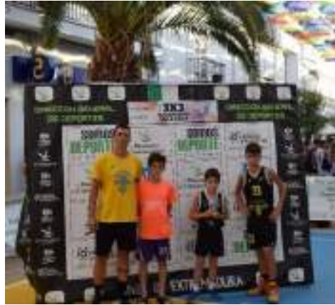
2º CLASIFICADOS SUB12 MIXTA