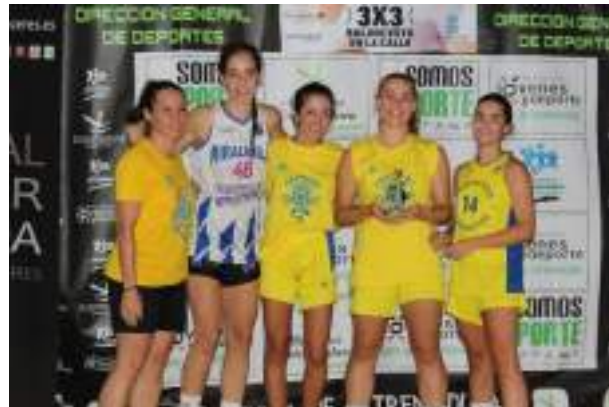
2º CLASIFICADAS SUB 16 FEMENINA

CAMPEONES 13ª EDICIÓN CAMPEONES DE LA 13ª EDICIÓN