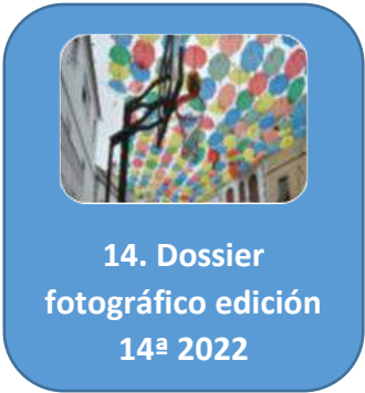
Dossier fotográfico, 14ª Edición 2022.