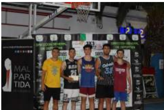
2º CLASIFICADOS SENIRO MASCULINA ABSOLUTA