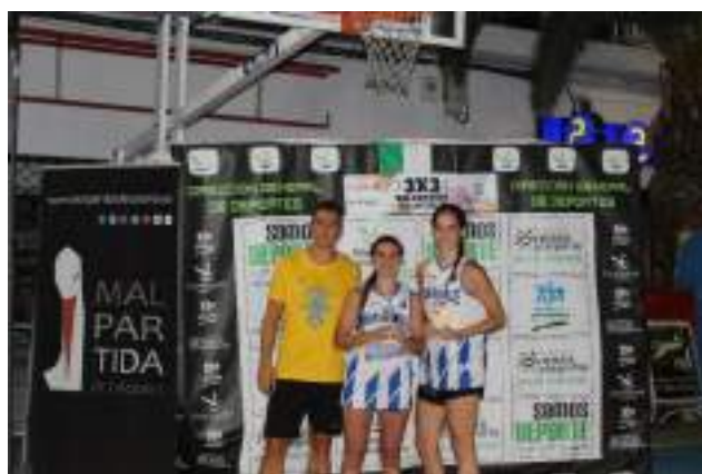
1ª CLASIFICADAS SENIOR FEMENINO