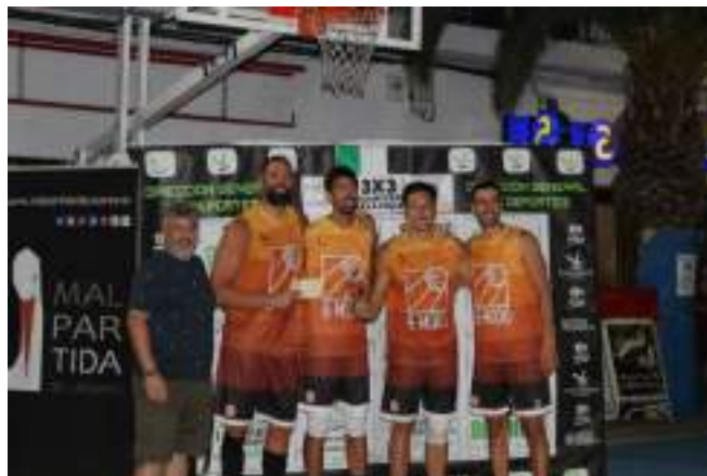
1º CLASIFICADO SENIOR MASUCNO ABSOLUTA