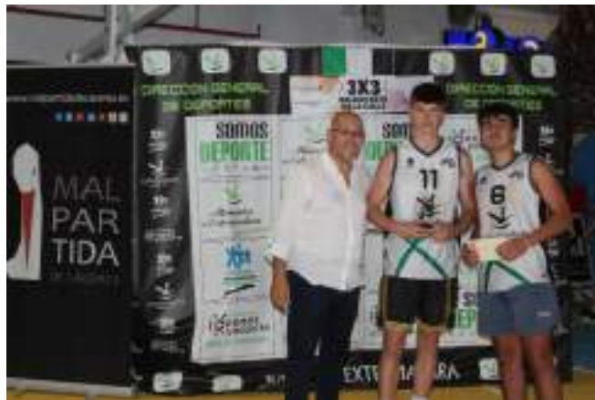
2º CLASIFICADO SUB 16 MASCULINA