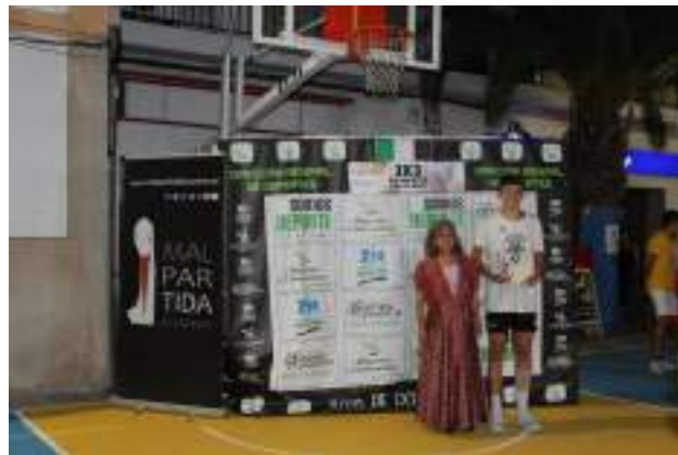
GANADOR CONCURSO DE TRIPLES ABSOLUTA