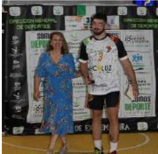
GANDOR DEL CONCURSO DE MATES