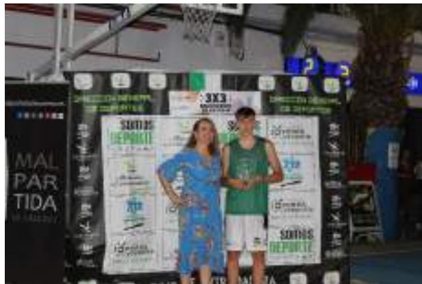
GANADOR CONCURSO DE TRIPLES SUB 16