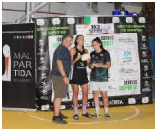
1º CLASIFICADAS SUB 16 FEMENINO