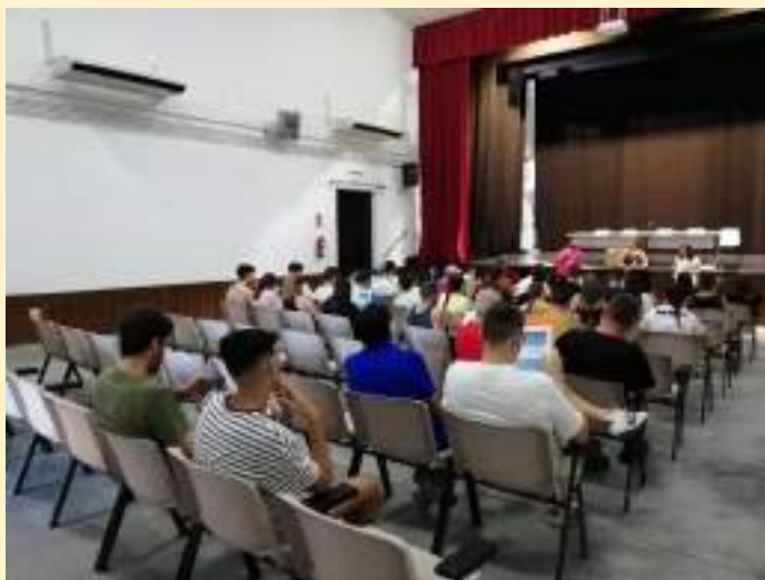
Imagen de reunión voluntarios 2022