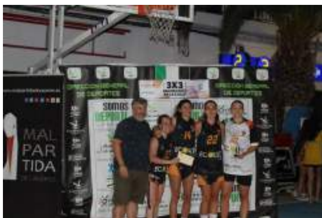
2ª CLASIFICADAS SENIOR FEMENINO