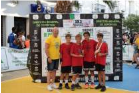
1º CLASIFICADO SUB 12 MIXTA